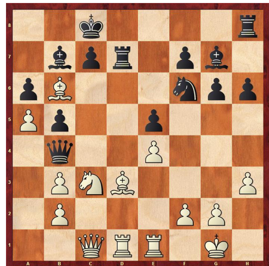
Weiß am Zug gewinnt!