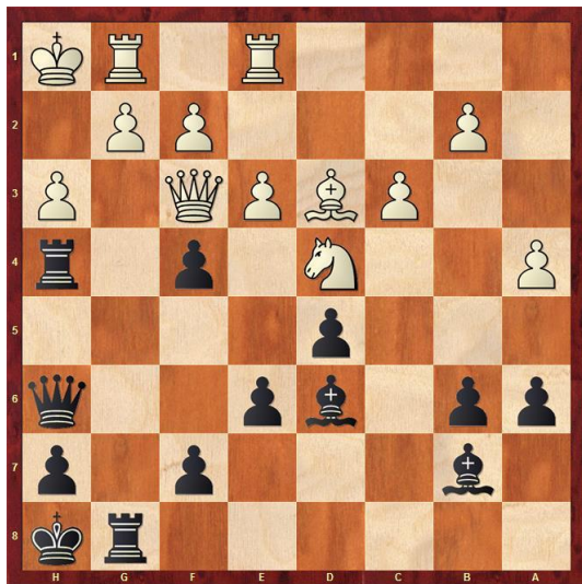
Schwarz am Zug gewinnt!